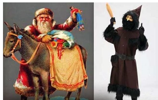
Пэр Ноэль и Шаланд (Франция)

У французов сразу два Деда Мороза. Первый – Пэр-Ноэль или Отец Рождество добрый