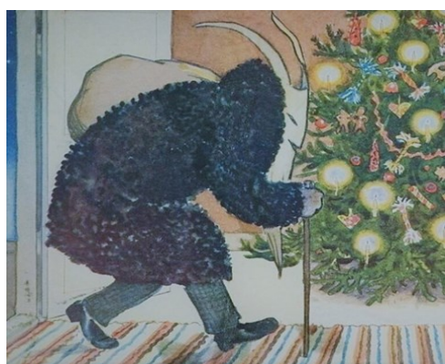
Юлебукк (Норвегия, Швеция)

появления тоже интересная. Образ появился из рождественской традиции, когда люди переодевались и пели песни. Популярный образ ряженого как раз-таки был именно таким. Маска с рогами и шкура козла. С течением времени традиции изменили суть образа и Юлебукк начал приносить подарки.